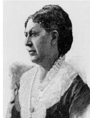
Clémence de Grandval Messe 1867